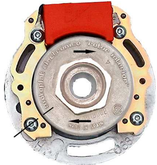
Figuur 3 (rechtsdraaiend)